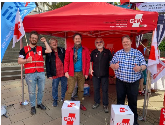
2024 Fotos GEW SiWi